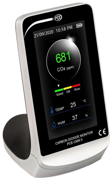
Das CO2 / Kohlenstoffdioxid Messgerät PCE-CMM 5