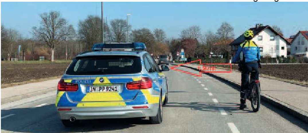
Foto und Text: Benjamin Brückner, Polizeihauptkommissar, PI Erding

Obwohl es bislang keine gesetzliche Helmpflicht gibt, schützt ein Fahrradhelm in vielen Fällen vor schweren Verletzungen. Etwa zwei Drittel der bei Fahrradunfällen zum Teil schwer verletzten Personen haben nachweislich keinen Helm getragen.