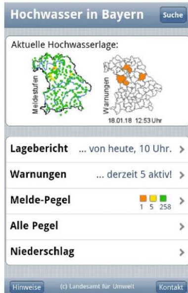
Bild 2: Auf https://m.hnd.bayern.de/ können Sie sich ganz einfach über die aktuellen Wasserstände in Flüssen informieren.

Bild 1: Das Online-Angebot https://m.hnd.bayern.de/ bietet alle Hochwasserwarnungen auf einen Blick.