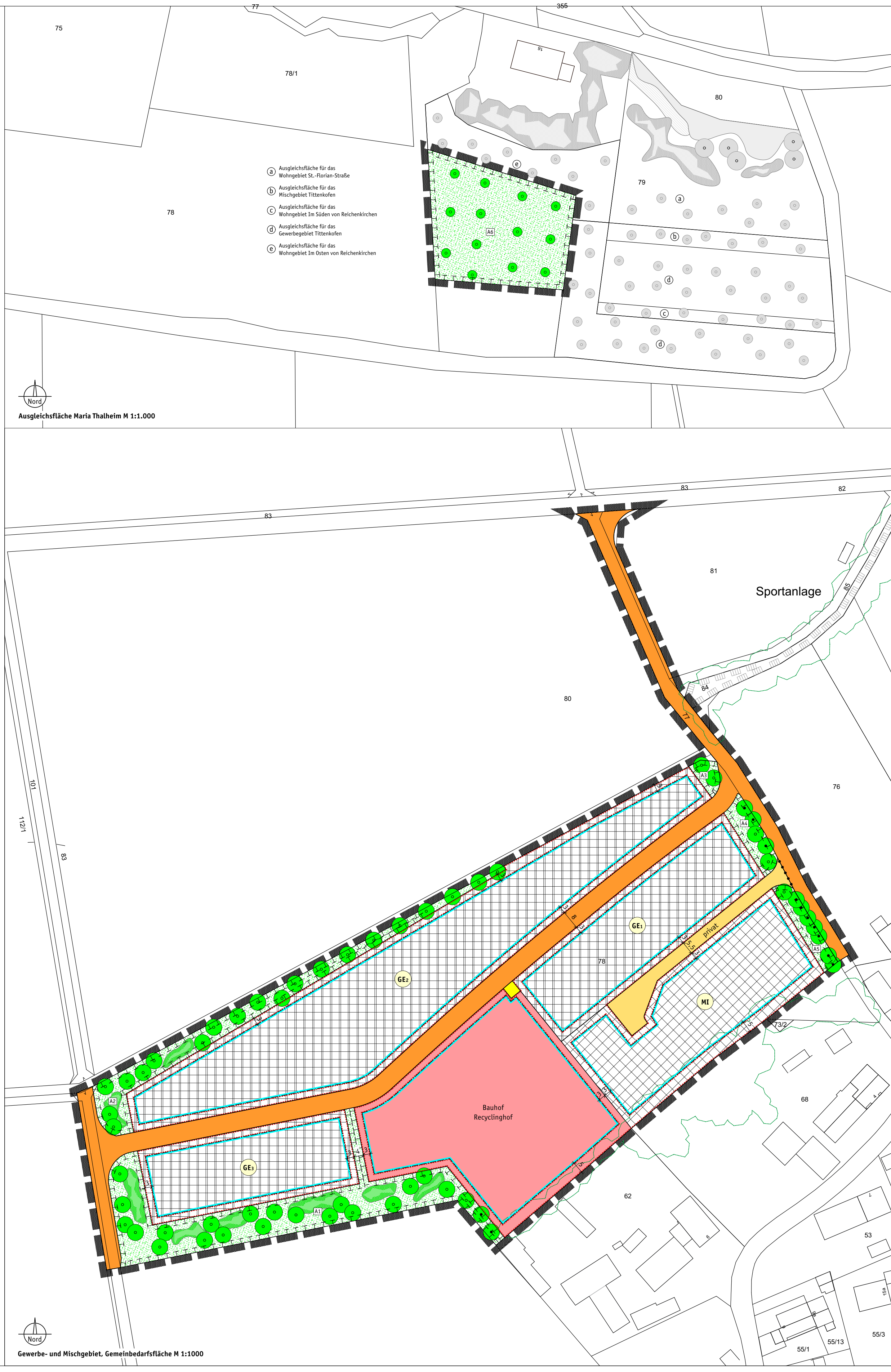
Gewerbe- und Mischgebiet, Gemeinbedarffläche M 1:1000