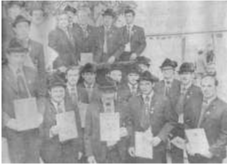
Ehrungen Reichenkirchener Schützen beim Jubiläum durchgeführt