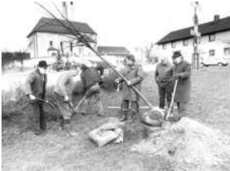
Gemeinderat pflanzt zwei Lindenbäume in Fraunbergs Dorfmitte