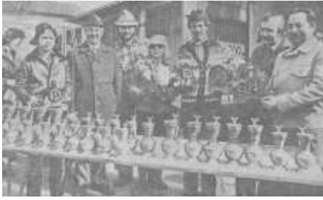
Die Pokale für die Wanderfreunde