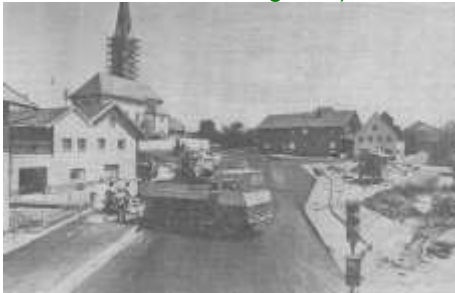
In der Ortsmitte Fraunberg wird gebaut