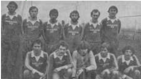
Aufsteiger in die B-Klasse