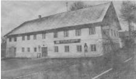
Das Fraunberger Gasthaus Stulberger vor dem Abbruch