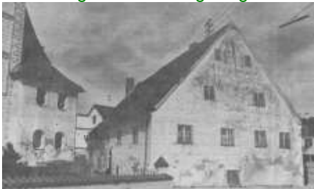
Das Thalheimer Mesnerhaus 1983