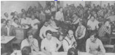
Besucherandrang bei der „Wasserversammlung“ in Oberbierbach