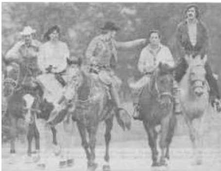
Die Cowboys von der Stürzlhamer Ringo-Ranch