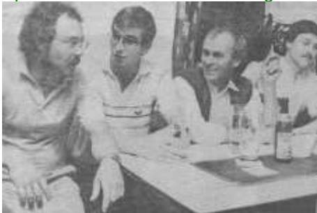
Die Vorstandschaft der SGR