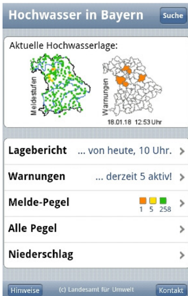
Bild 2: Auf https://m.hnd.bayern.de/ können Sie sich ganz einfach über die aktuellen Wasserstände in Flüssen informieren.

Bild 1: Das Online-Angebot https://m.hnd.bayern.de/ bietet alle Hochwasserwarnungen auf einen Blick.