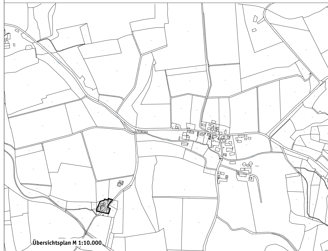
Übersichtsplan M 1:10.000

§ 4 Diese Satzung tritt mit ihrer Bekanntmachung in Kraft.