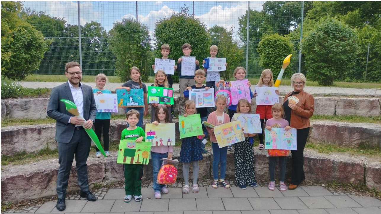
Die Gewinner am Schulstandort Maria Thalheim