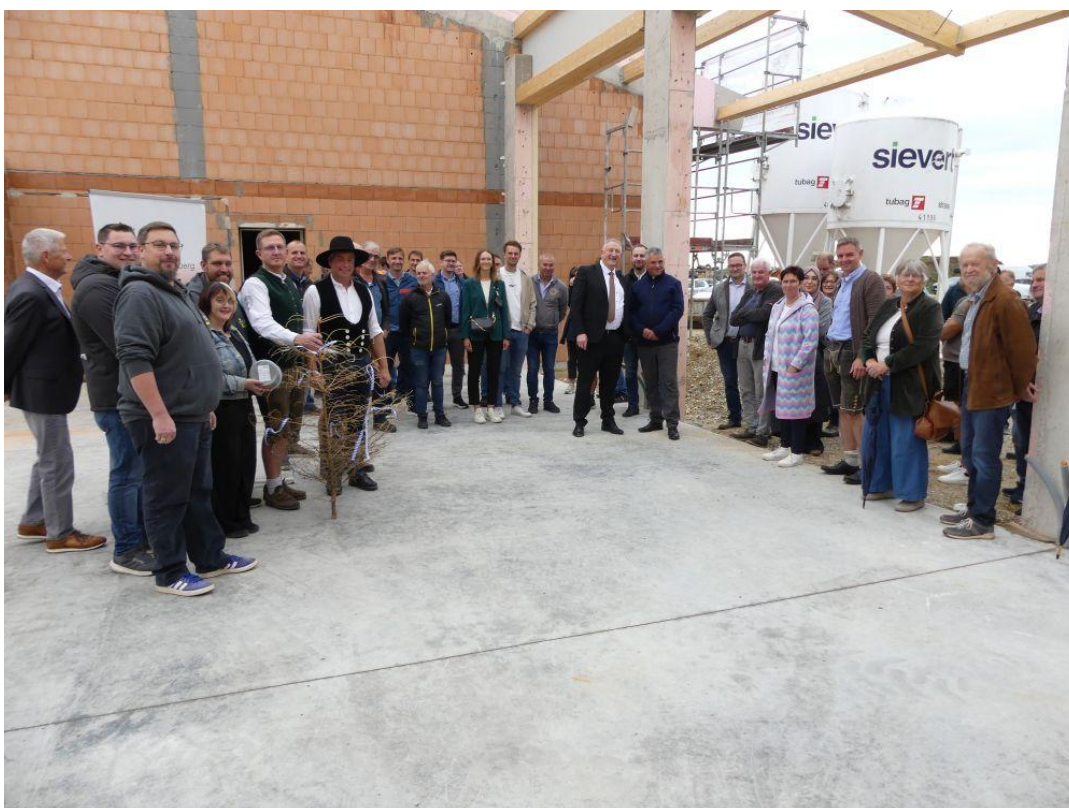
Gruppenbild der am Richtfest beteiligten Text und Fotos: R.H