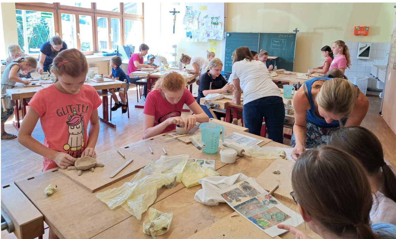
Veranstaltung vom 07.08.. – Töpferkurs, Landfrauen Fraunberg

ist es uns auch heuer wieder gelungen, für Kinder verschiedener Altersgruppen ein abwechslungsreiches und buntes Ferienprogramm auf die Beine zu stellen.