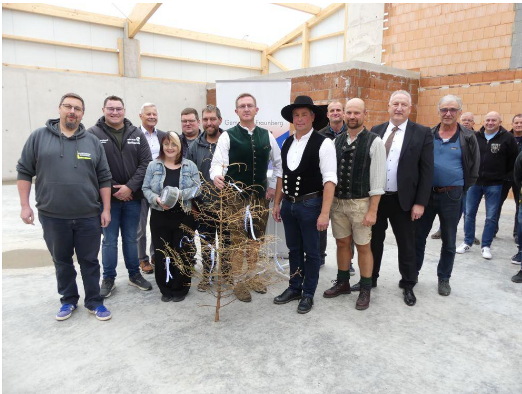
Die Freiwillige Feuerwehr Reichenkirchen übergibt den Richtbaum

diesem Zeitpunkt noch nicht geklärt werden. Dem Bürgermeister und den Anwesenden war die Freude über die Ausübung dieses traditionellen Brauchs anzusehen und so denke ich, kann man getrost davon ausgehen.