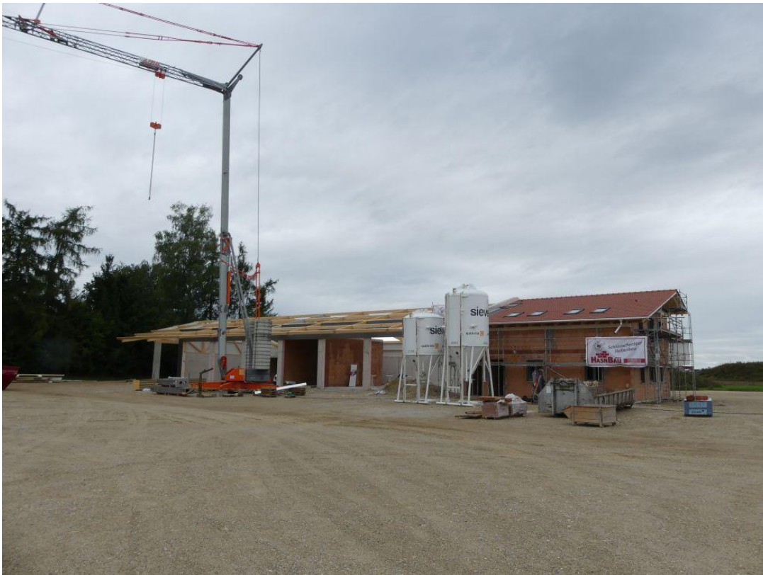
Der westliche Baukörper

Das Gebäude auf der östlichen Seite des Bauhofgeländes mit 25,00 m x 11,50 m (290 m 2 ) beinhaltet Salzlager, Hackschnitzellager und Kaltlager.