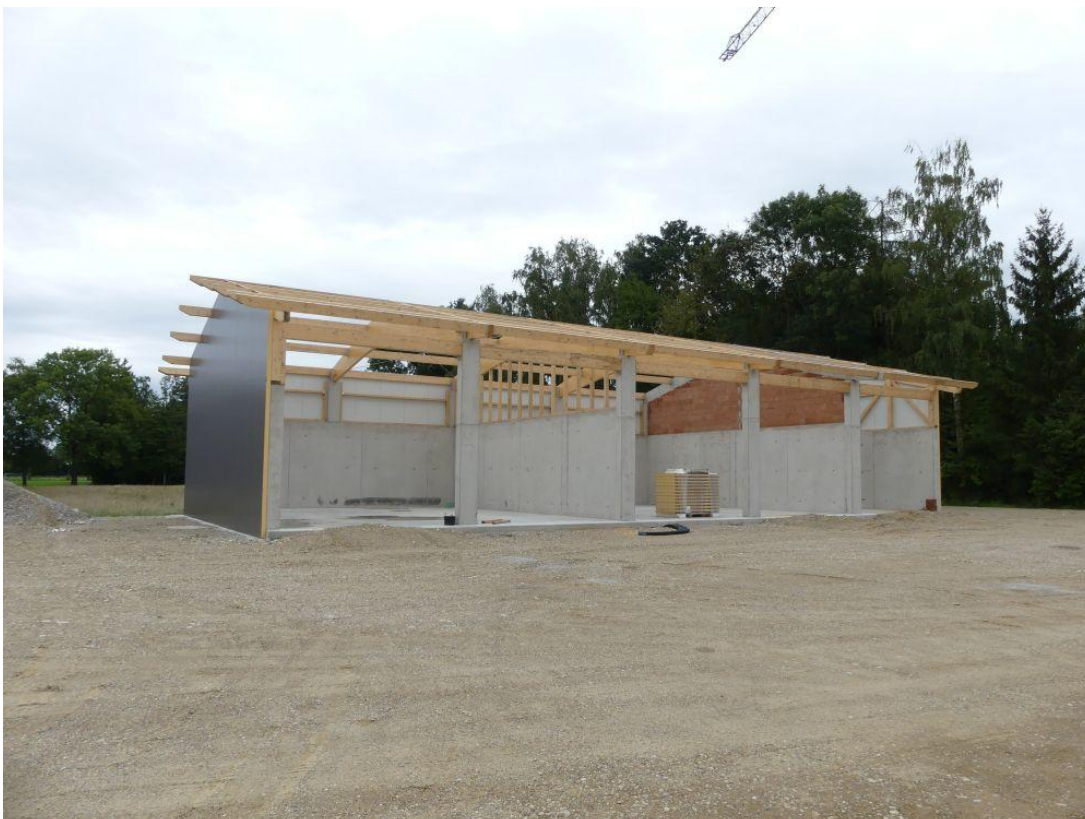
Der östliche Baukörper

Der Bruttorauminhalt beider Gebäude beträgt 7.375 m 3 . Die Baukosten liegen lt. Generalangebot der Fa. HasnBau, Oberneuching, bei rund 1.950.000 €.