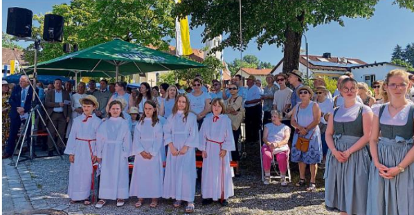
Die Festgemeinde und die Erstkommunikanten der fünf Pfarreien des Pfarrverbandes versammeln sich zum Festgottesdienst auf dem Dorfplatz.

Die Gläubigen verehrten zu der Zeit der ersten Wallfahrt nach Thalheim der Legende nach ein Marienbildnis, das sich unter einem Hollerstrauch befand. Sie errichteten ein Bildnis für die Kapelle und brachten es dorthin. Die Legende besagt, dass es am nächsten Tag wieder an seinem ursprünglichen Platz in der Hollerstaude zurückgekehrt sei.